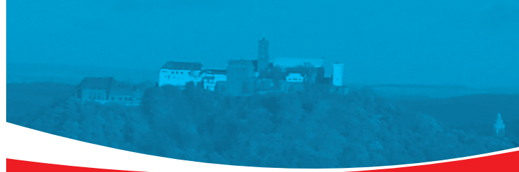
Foto Wartburg

Aufgrund der Förderung des Projektes „Fokus Tierwohl“ durch das BMEL ist die Teilnahme an der Veranstaltung kostenfrei.